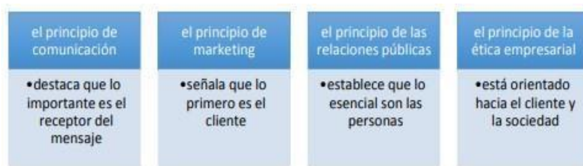
Figura 3. Principios de Comunicación, Marketing, Relaciones Públicas y Ética Empresarial

Como conclusión se define, la comunicación corporativa se erige como un pilar estratégico y no solo como una disciplina. La comunicación organizacional implica a toda la organización desde una actitud orientada al cliente, al mercado y a la opinión pública. En esta actitud convergen cuatro principios que son: