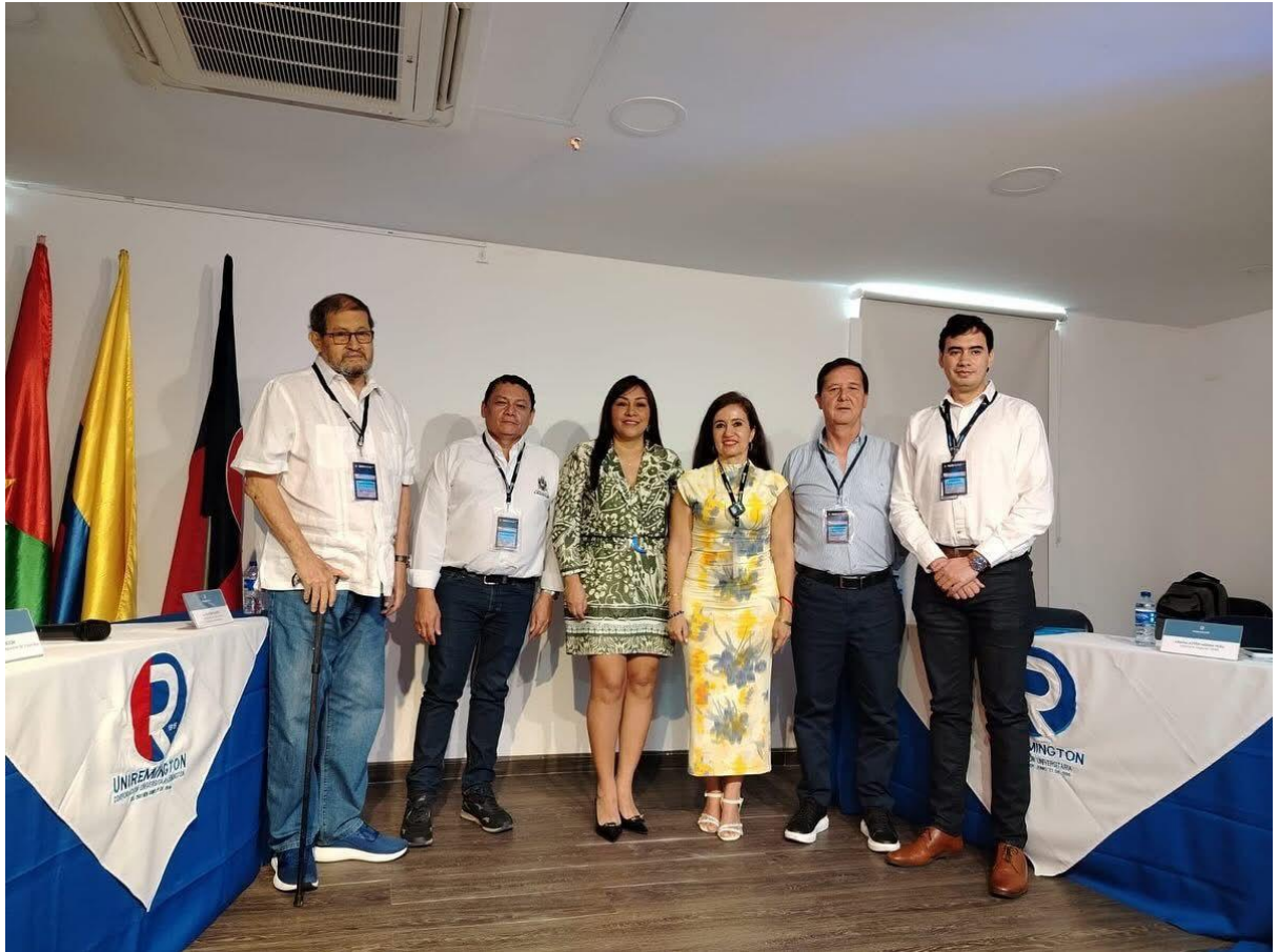
Nota. Fotografía tomada durante el IV Congreso Internacional de Ciencias Empresariales en la sede Yopal.