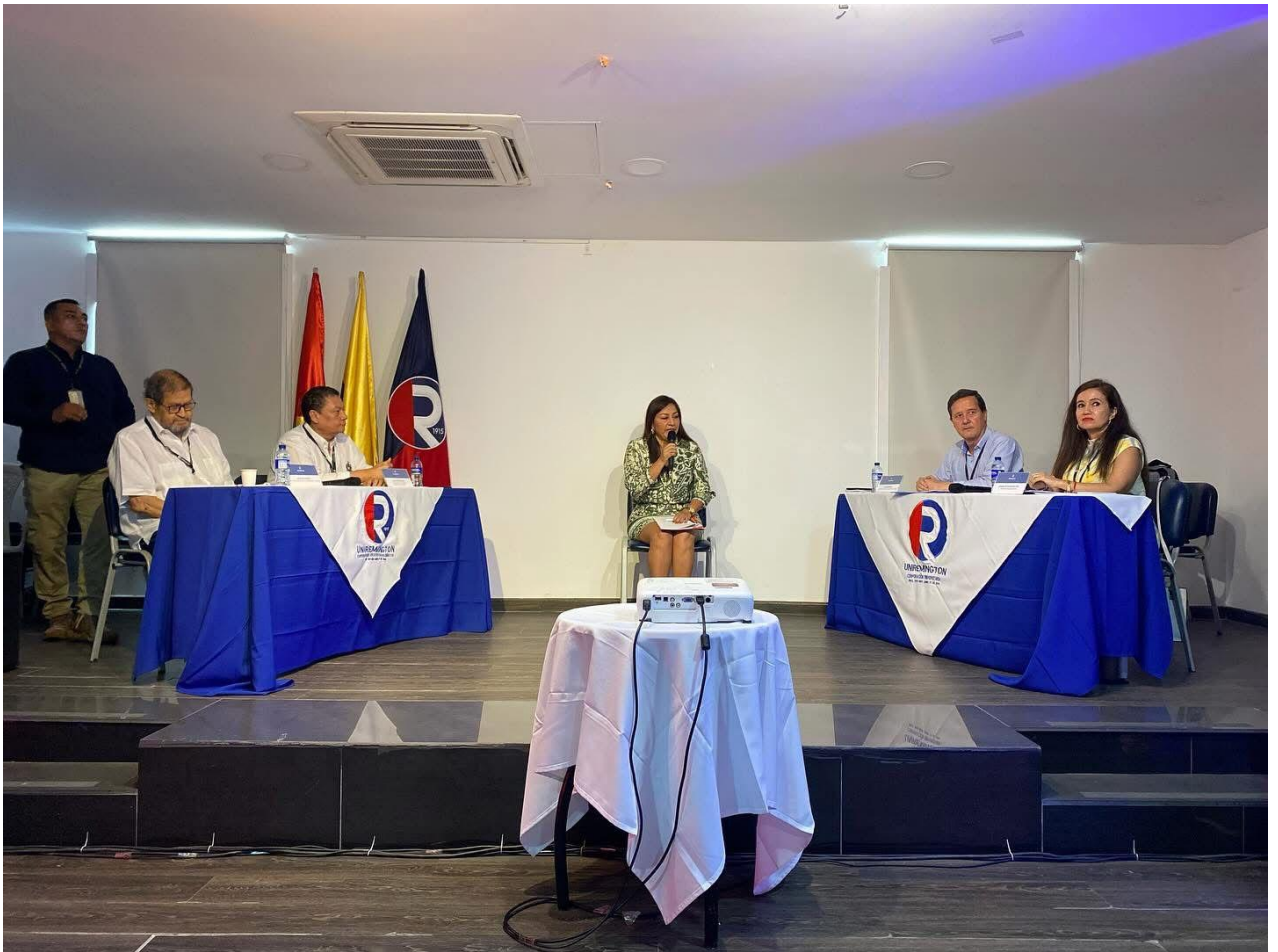
Nota. Fotografía tomada durante el IV Congreso Internacional de Ciencias Empresariales en la sede Yopal.