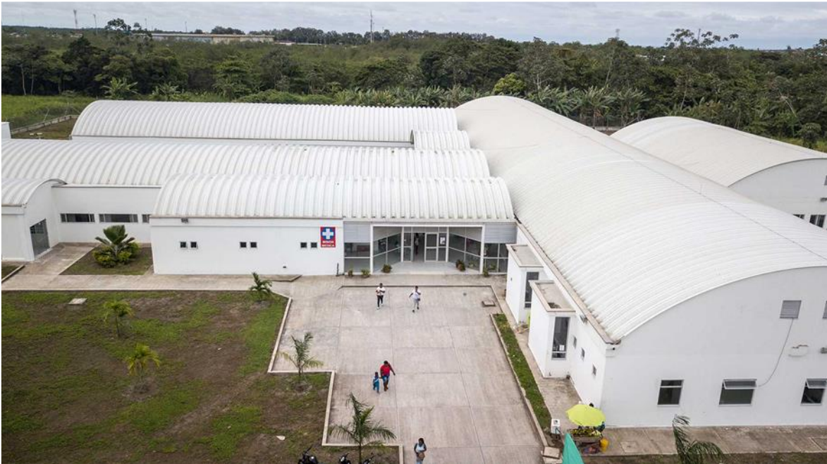
Figure 1 E.S.E CENTRO HOSPITAL DIVINO NIÑO EN TUMACO 2023.