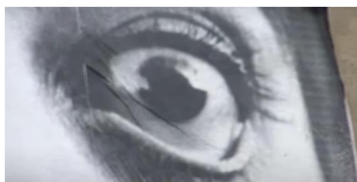
Figura 11. Póster de imagen de ojo abierto sobre una pared.