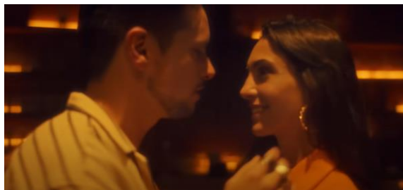
Figura 4. Mirada entre dos personas bailando.