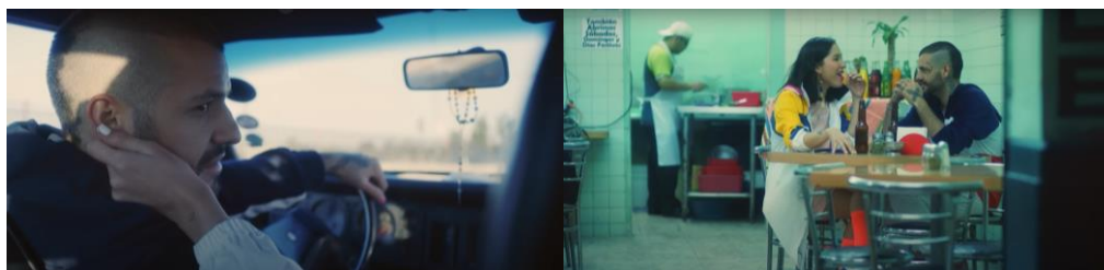
Figura 3. Mirada entre dos personas sentadas.