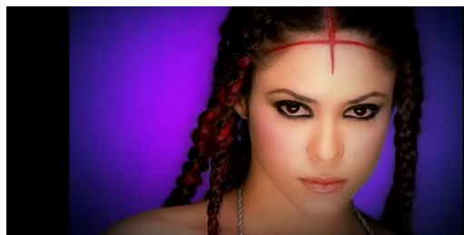
Figura 9. Mirada Shakira.