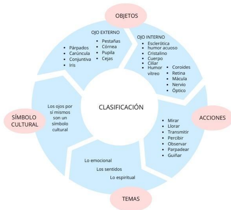
Figura 1. Esquema clasificación - etapa 2 de la ruta metodológica.

Nota. Esquema clasificación - etapa 2 de la ruta metodológica, de David Restrepo y Mériel