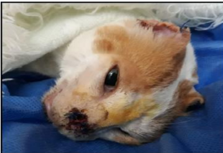
Figura 3 paciente luego de remoción quirúrgica de CCE