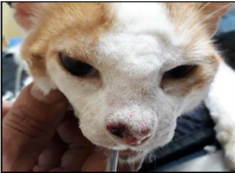
Figura 2 lesión ulcerativa bilateral en plano nasal

Consiste en el uso sistémico de diversos agentes antineoplásicos por vía parenteral u oral, solos o en poliquimioterapia combinada con el objetivo de eliminar la diseminación hematogena subclínica de posibles micro-metástasis y aumentar el control loco-regional del tumor primario actuando sobre las células malignas residuales tras cirugía. Los fármacos citotóxicos más ampliamente descritos son el carboplatino, doxorrubicina, metrotexato y paclitaxel, habiéndose documentado que la introducción de quimiosensibilizadores reduce significativamente el riesgo de recaídas tumorales (Vail et al., 2022). También cabe destacar los esquemas de quimioterapia metronómica a bajas dosis constantes sin periodos libres de tratamiento o los protocolos de quimio inmunoterapia combinada.