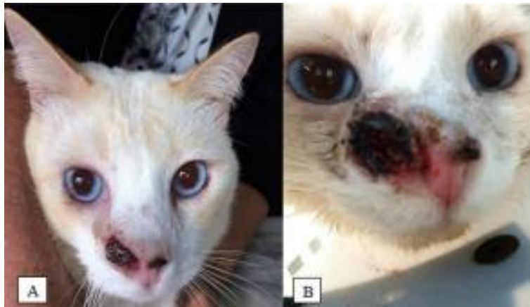
Figura 6 criocirugía A) paciente con el plano nasal cubierto por una costra una semana después de la primera sesión de criocirugía. B) paciente con el plano nasal cubierto por una costra una semana después de la segunda sesión de criocirugía