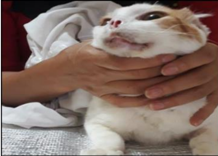
Figura 4 paciente después de 5 meses de tratamiento con quimioterapia metronómica