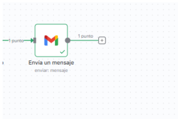
Figura 3. Configuración del nodo de Gmail en n8n para el envío automático del correo de confirmación con el PDF adjunto.

Esta representación gráfica permite entender cómo n8n toma el binario generado en el paso anterior y lo convierte en un adjunto de correo, cerrando de forma automática el ciclo de comunicación con el paciente. Al mismo tiempo, evidencia la importancia de mapear correctamente el nombre del campo binario y de configurar adecuadamente las credenciales de Gmail mediante OAuth2.