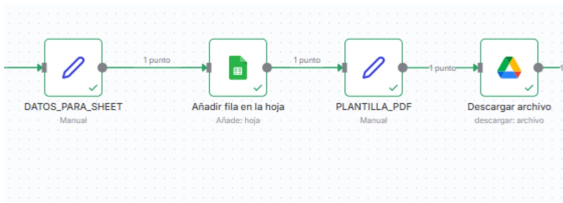
Figura 2. Parte del flujo de n8n encargada del registro en Google Sheets y la generación del PDF mediante Google Drive.

Esta figura permite visualizar con claridad cómo los datos estructurados se transforman en una fila dentro de la hoja de cálculo Citas_Medicas_N8N, y posteriormente cómo el documento se exporta a PDF mediante la conversión de archivos de Google. De este modo, se evidencia el papel de Google Sheets como repositorio de información y de Google Drive como herramienta para generar documentos formales a partir de esos datos.