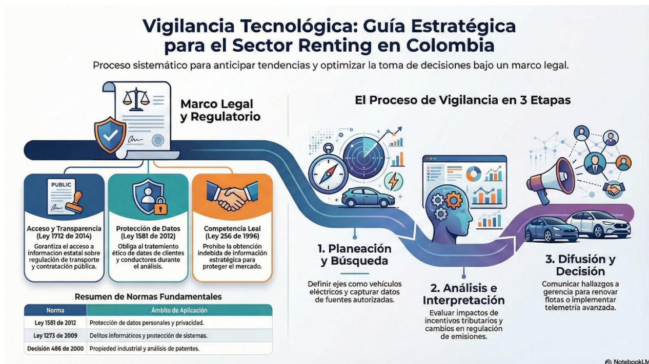
Figura 3. Vigilancia tecnológica

La empresa debe implementar políticas internas de cumplimiento normativo y gobierno de la información.