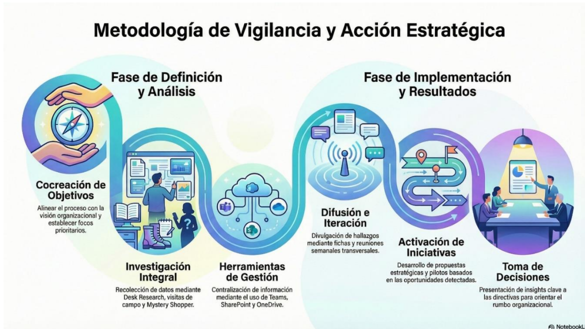
Figura 4. Metodología de vigilancia tecnológica