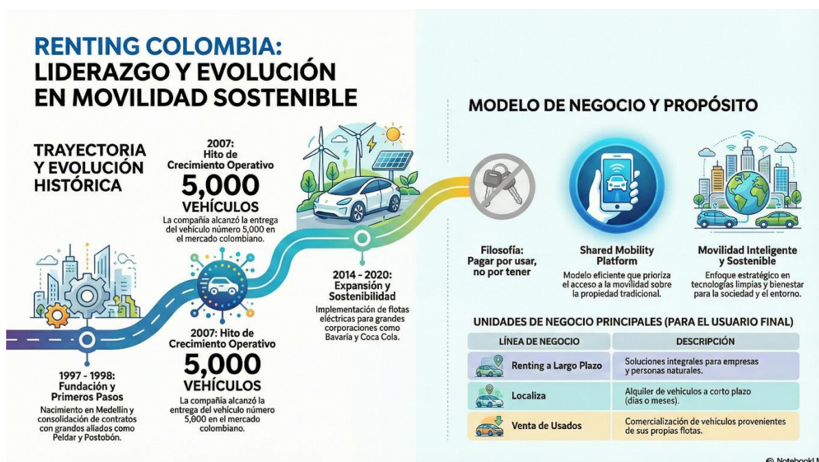
Figura 1. Renting Colombia

Los valores corporativos de Renting Colombia no siempre se enlistan textualmente en sus páginas, pero su cultura organizacional destaca principios como innovación, eficiencia, enfoque en el cliente, sostenibilidad y transformación positiva. Estos valores orientan la gestión del arrendamiento, la atención al cliente y la contribución de la empresa al desarrollo social y ambiental del país (Renting Colombia, s. f.).