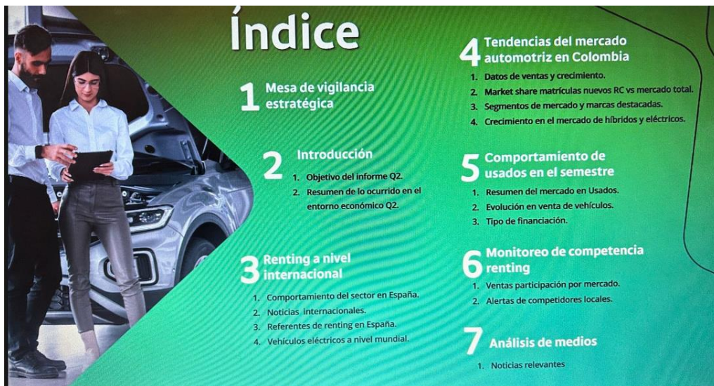
Figura 5. Presentación Renting

Por ser información interna de la empresa se muestra el índice de lo realizado en una presentación de 40 slides.