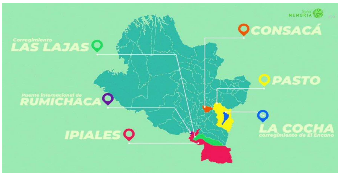
Figura 1.-Geografía municipio de Ipiales, Nariño, Colombia

Nota: Geografía del municipio de Ipiales. Tomado de (Señal Memoria, 2022)