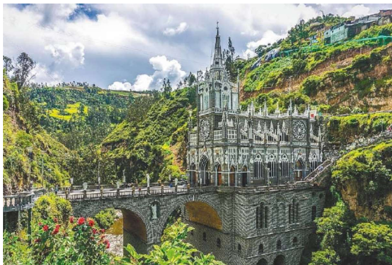
Figura 3.-Santuario de las lajas 2024

Nota. Construcción de la primera iglesia pajiza por Fray Gabriel Villafuerte en 1.754.