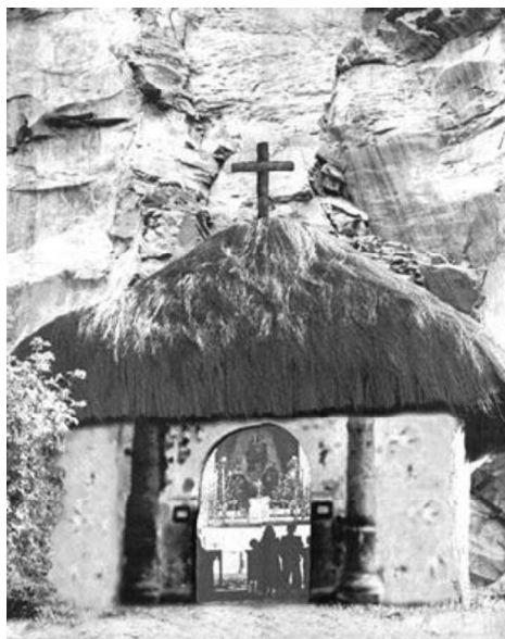
Figura 2.- Primera iglesia pajiza de las Lajas

Además, Ipiales es conocido por su vibrante cultura, con festividades y tradiciones que reflejan la mezcla de influencias indígenas y coloniales, el intercambio cultural con Ecuador también ha enriquecido la vida social y económica de Ipiales (Cultura de Ipiales, 2015).