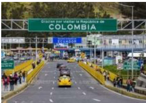
Figura 4.-Turismo en la zona fronteriza Colombia - Ecuador

La devaluación puede hacer que los productos y servicios en Colombia sean más atractivos para los turistas ecuatorianos, quienes pueden aprovechar el tipo de cambio favorable generando el aumento de turistas a Ipiales, lo que significa una oportunidad de venta para las empresas.