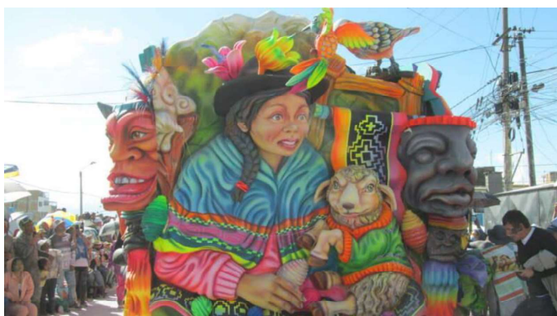
Figura 6.- Carnaval multicolor Ipiales.

Al atraer turistas, se fomenta el interés por la cultura local, lo que puede impulsar la preservación de tradiciones y costumbres. Esto también, puede generar ingresos a través de eventos culturales y festividades, estas fechas son de indispensable importancia, ya que, al haber mayor afluencia de turismo, se incrementa el comercio en el municipio de Ipiales.