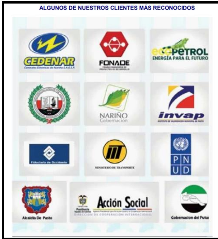
Figura 4. Clientes más relevantes