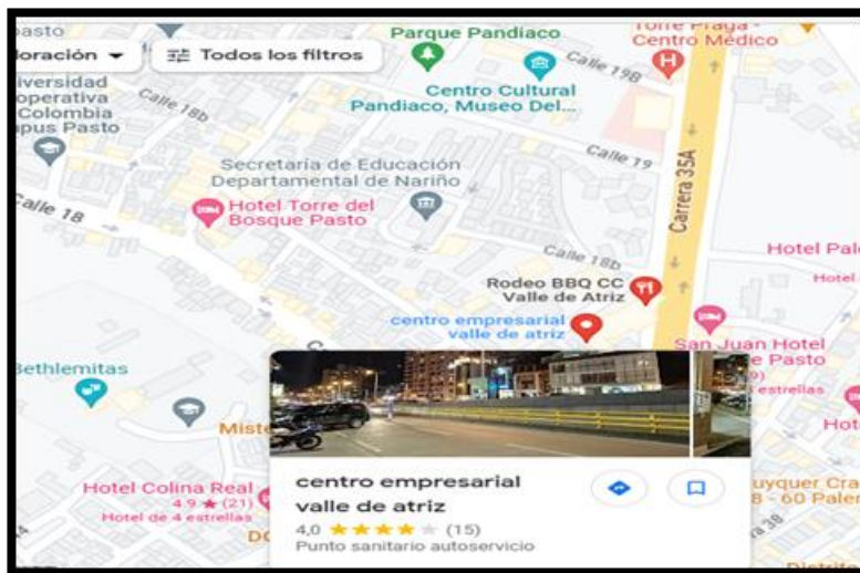
Figura 2. Localización específica de centro comercial valle de Atriz