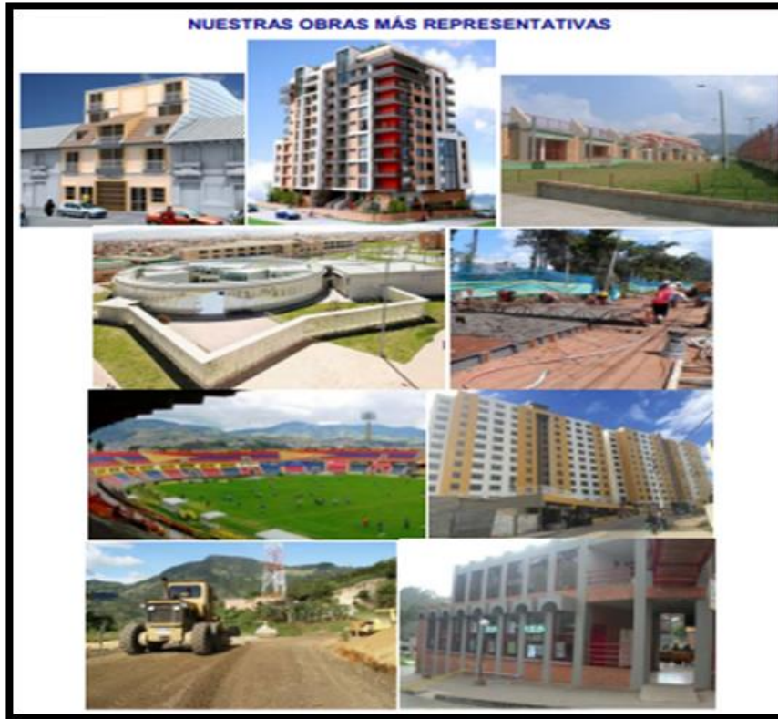
Figura 3. Obras ejecutadas más relevantes