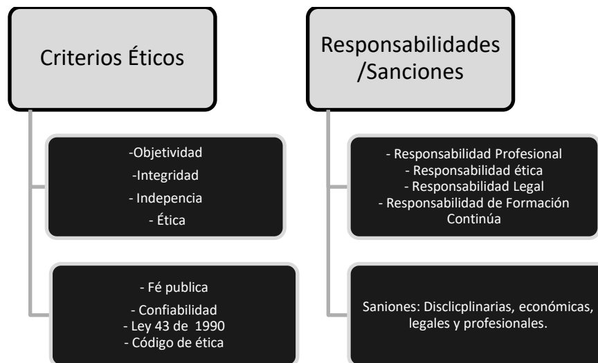
Figura 2. Criterios éticos a evaluar vs sanciones para el profesional