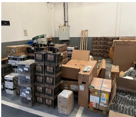
Bodega Mazda Recepción y Despacho – Montería Antes