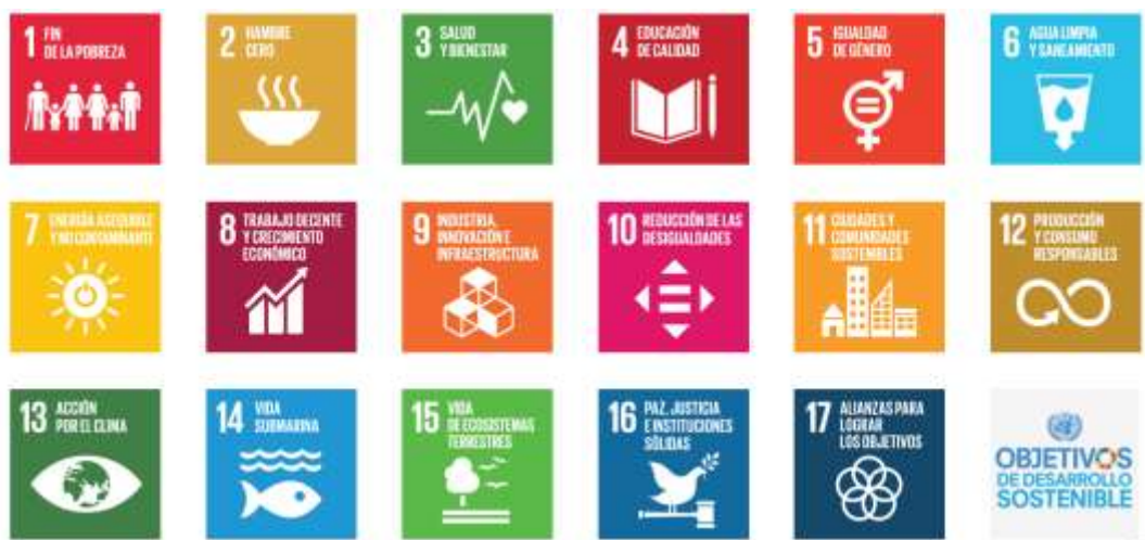
Figura 1. Objetivos de Desarrollo Sostenible.