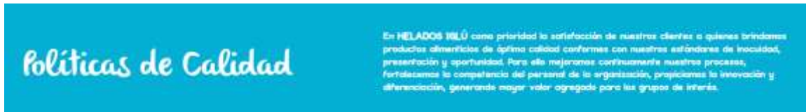
Figura 3. Política de Calidad Helados Iglú.