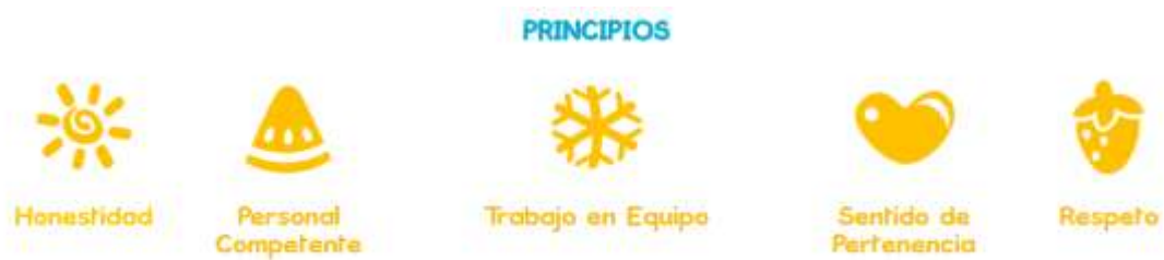
Figura 2. Principios corporativos Helados Iglú.