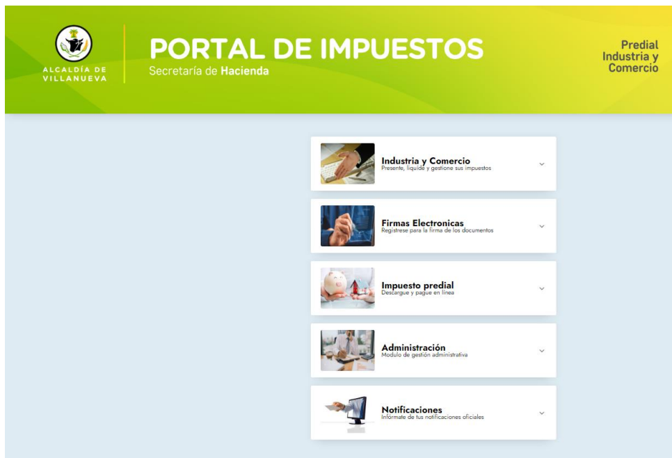
Ilustración 3 Portal de impuestos Secretaria de Hacienda