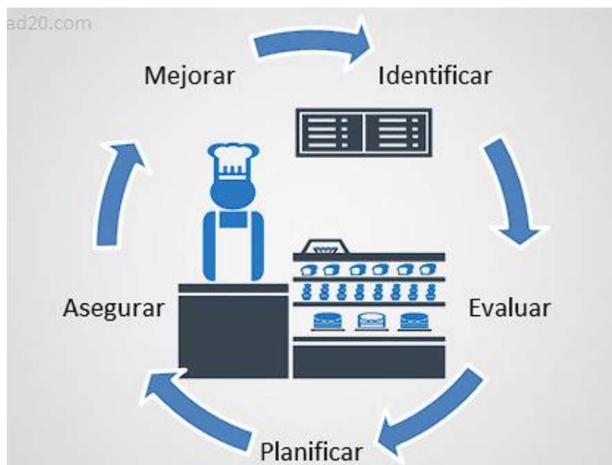
Gráfico 2. Básicos imprescindibles

Así mismo, la implementación de políticas internas de control y seguimiento a las obligaciones fiscales permitió que las PYMES comenzaran a desarrollar prácticas de prevención y medidas correctivas frente a contingencias posibles, que se desarrollaron mediante auditorías tributarias; programas de formación al personal contable; e incorporación de herramientas tecnológicas para el cumplimiento en línea de los tributos. En este sentido, Puentes et al. (2024) señalaron que aquellas PYMES que incorporaron mecanismos de control tributario, además de reducir el riesgo de recibir sanciones, reforzaron su capacidad de planificación financiera y mejoraron la confianza de inversores y entidades crediticias. De esta forma, la gestión del riesgo tributario dejó de