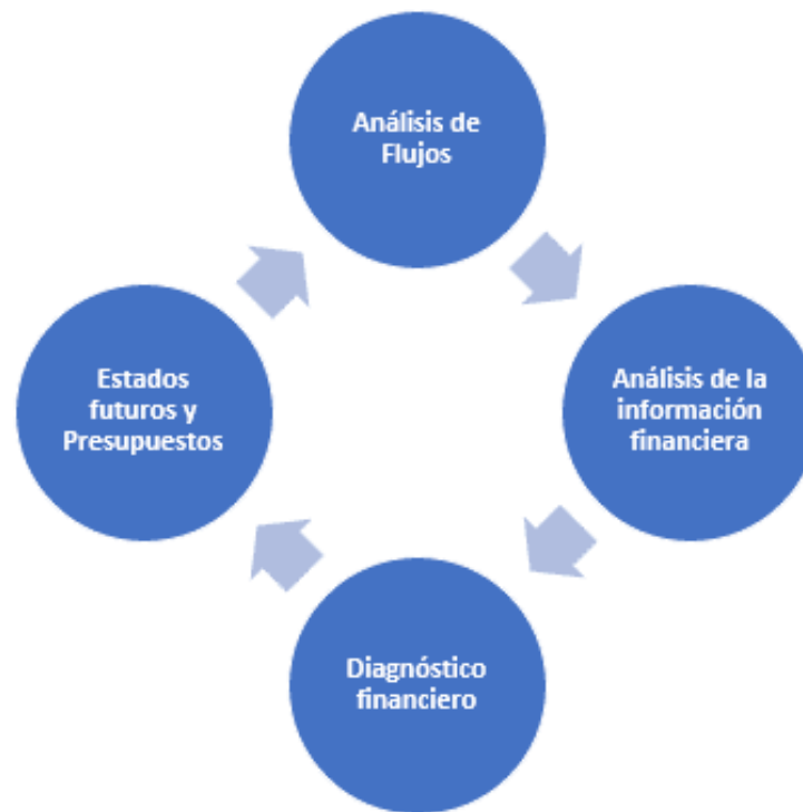
Gráfico 3. Planeación financiera

Así mismo, la capacidad demostrada de la educación tanto financiera como tributaria en la toma de decisiones estratégicas actuaron como un elemento potenciador de una cultura empresarial que se basa principalmente en el hecho de prevenir y de planificar, lo que significa que este aprendizaje constante fue en consonancia con el hecho de reducir los riesgos de incumplir y al mismo tiempo aumentar la capacidad de competir por parte de las PYMES dado que los entornos cada vez son más inestables y dinámicos. Esta capacidad de educar, formaba en los gestores de las grandes empresas la inclusión de prácticas de la planeación tributaria con un horizonte que señalaba a la sostenibilidad donde la legalidad y la eficiencia continuaban siendo de vital importancia, lo que sumado al constante proceso de formación se erigía en un medio que posibilitaría el empoderamiento así como la resiliencia y la capacidad de competir de las PYMES (Mora, 2025).