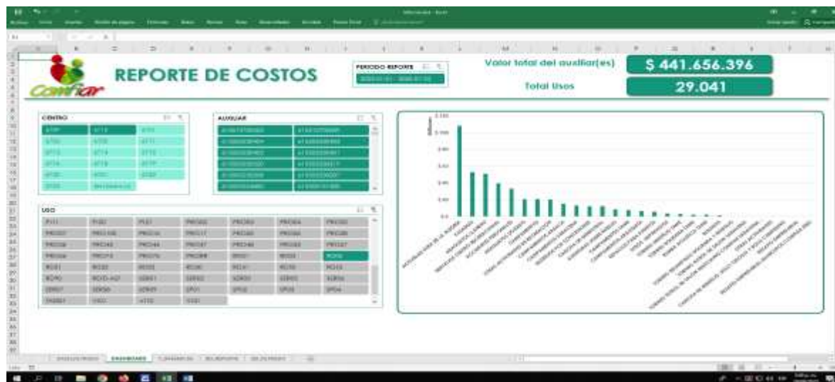
Figura 4 Reporte completo auxiliares 1 - 6 - B