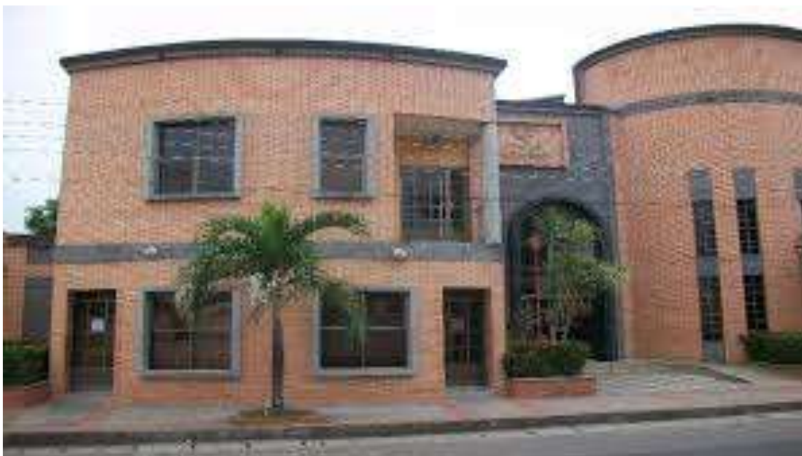
Imagen 1 Edificio Comfiar Municipio de Arauca