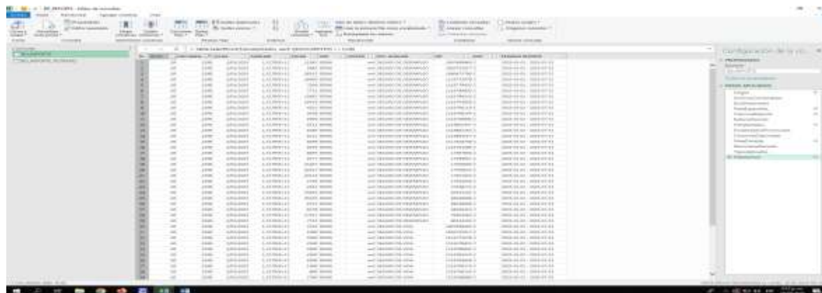
Figura 5 Consulta reporte auxiliares 1 - 6