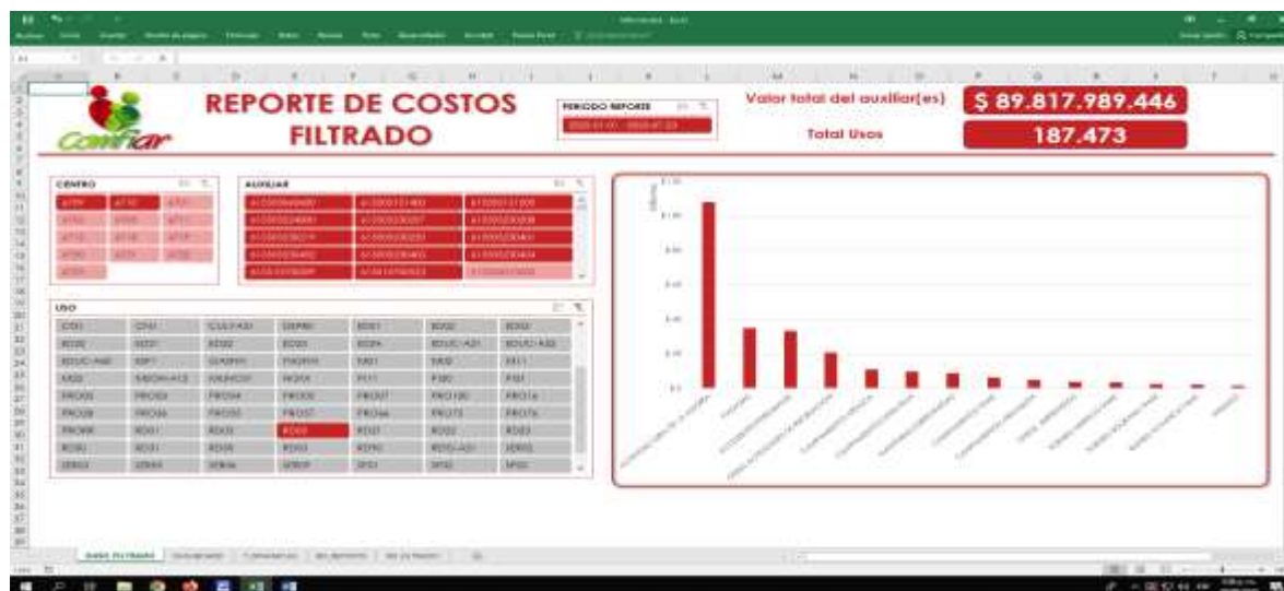
Figura 2 Reporte filtrado solo auxiliares 5 y 6 - B