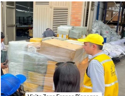
Visita Zona Franca Rionegro