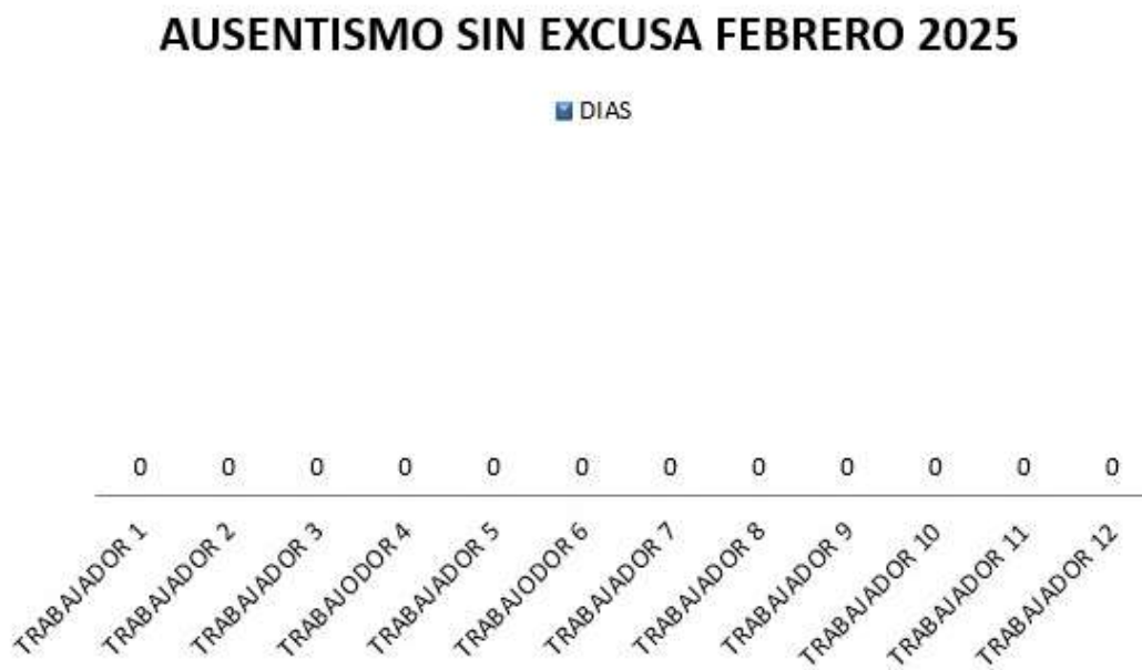
Figura 3. Estadística ausentismo sin justa causa febrero 2025. Objetivo 1.

Nota: en el mes de enero se evidencio un ausentismo del 3.03%, que refleja una pérdida de $ 644.640.