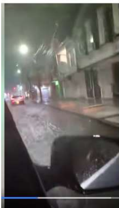
Ilustración 4. Captura de video de calle inundada en Tumaco