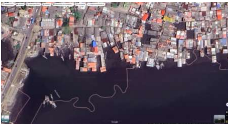
Ilustración 2. Barrios construidos sobre el mar.