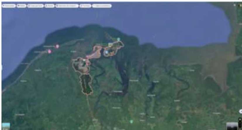
Ilustración 1. Ubicación geográfica de Tumaco