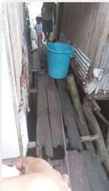
Ilustración 3. Puentes del barrio panamá - Tumaco