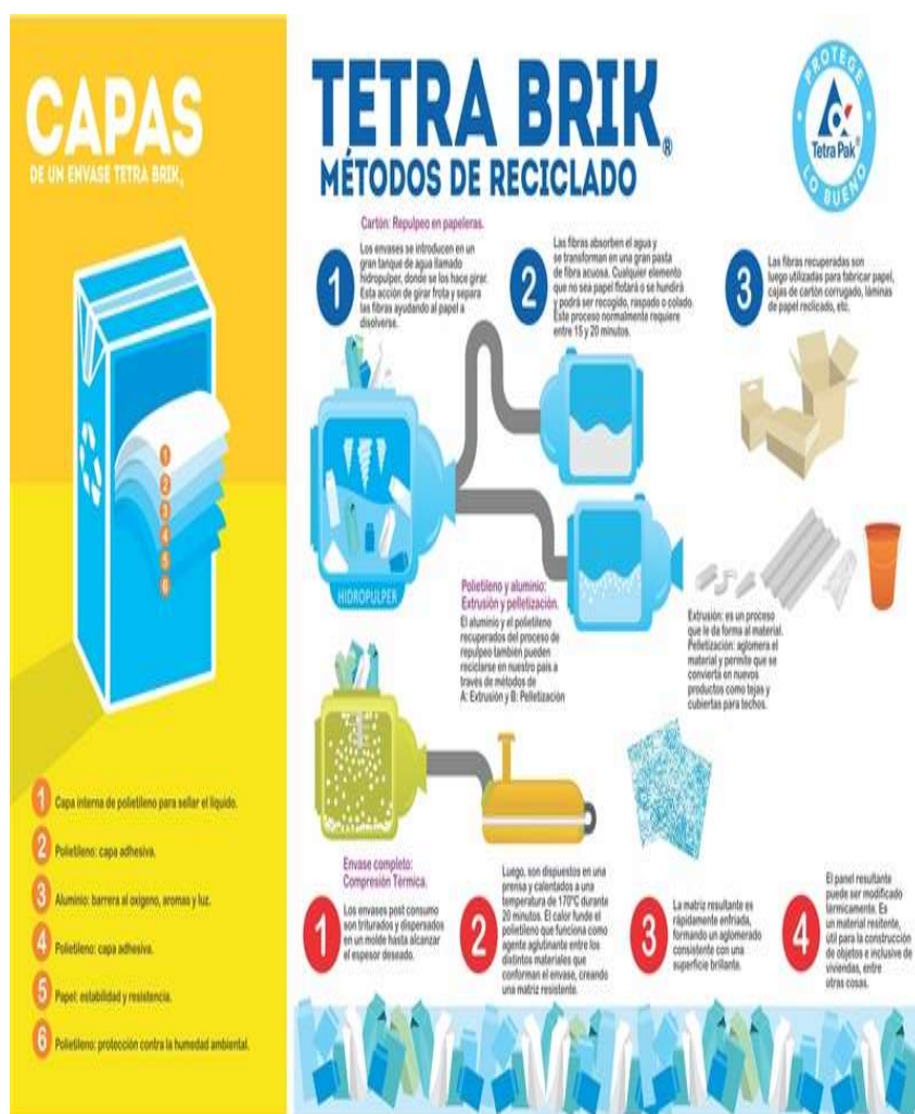
Figura 2 - ¿Cómo se recicla un tetra pak?

De esta manera se logra un crecimiento y desarrollo económico y social que deja huella frente al impacto climático en nuestro planeta, se debe seguir trabajando de la mano de los diferentes sectores económicos y social de nuestro país, para que la sociedad se eduque y se haga consiente del daño que hace con cada botella, papel, pitillo desechado en las calles y drenajes que todos debemos aportar nuestro grano de arena para mejorar y cambiar el destino de nuestra ecosistema donde todos nos beneficiamos.