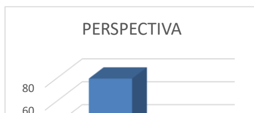
Figura 3 perspectiva de los comerciantes con respecto al régimen simple de tributación

https://consuempresa.com/retencion-en-la-fuente-regimen-simple-de-tributacion/