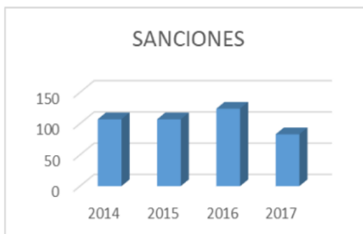
Gráfico 1. Comportamiento de las sanciones impuestas por la JCC. Recuperado de: http://www.jcc.gov.co/jcc/2013-05-31-02-44-41/informes-de-gestion