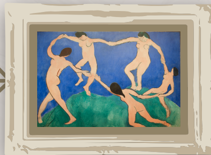
La danza por Henri Matisse

Simboliza la danza como forma de conexión y libertad . Es una pintura que muestra unidad a partir de la representación del movimiento.