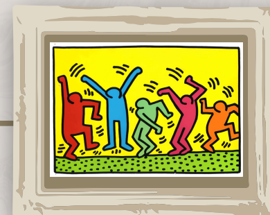
Sin título (Baile) por Keith Haring

El estilo gráfico de Haring se enfoca en el movimiento como un modo de energía y vida . En el cine, la danza puede ser retratada de forma estilizada o simbólica, tal como en esta obra.