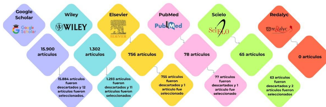
Figura 2: Diagrama de flujo del proceso de selección de estudios según la base de datos usada.