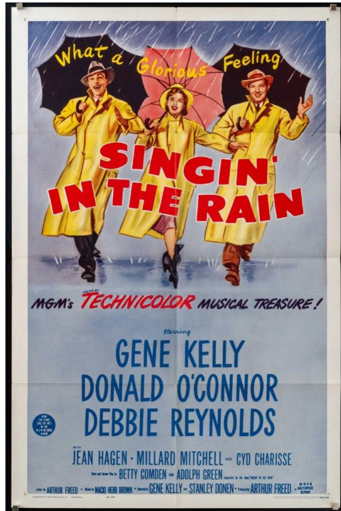
Imagen del póster original de la película Singin' in the Rain.