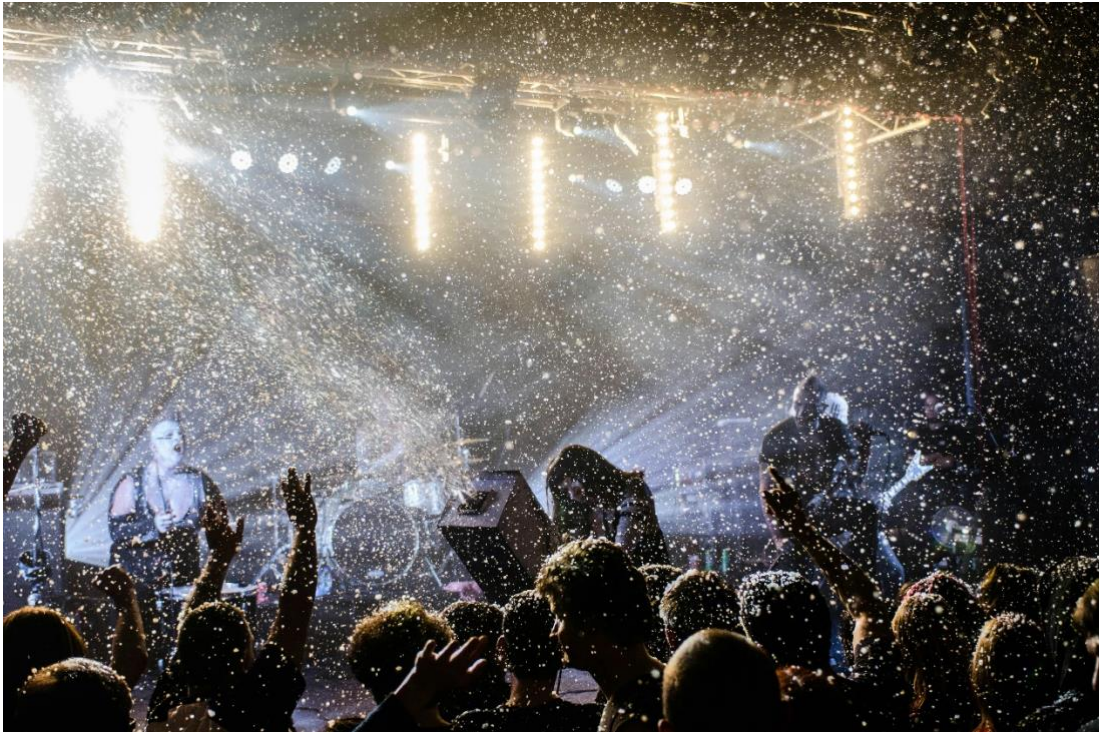
Figura 4 Concierto de Indie Rock.