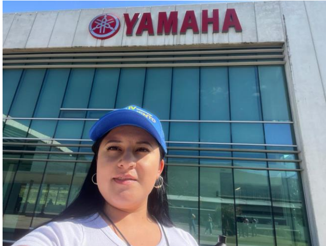
Ilustración 1. Visita empresarial Yamaha