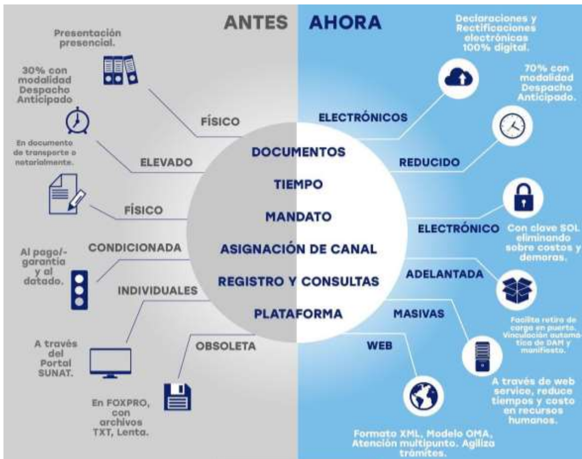
Ilustración 1: Flujo del Proceso de Despacho Aduanero Digital