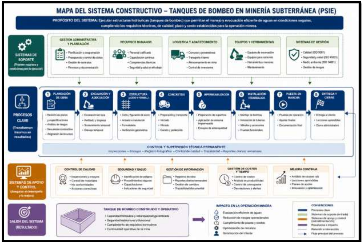
Ilustración 2: Sistema constructivo - Tanque de bombeo.