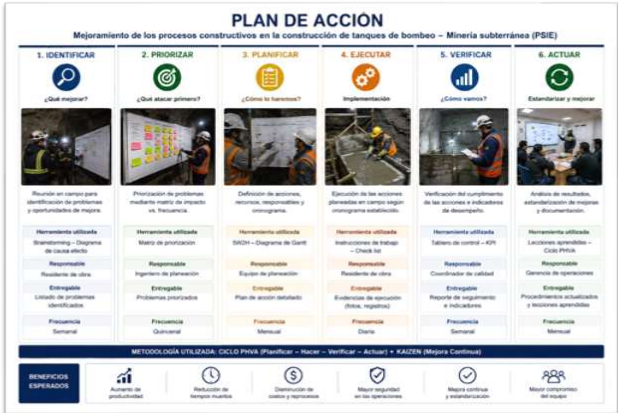
Ilustración 3: Estrategias propuestas.