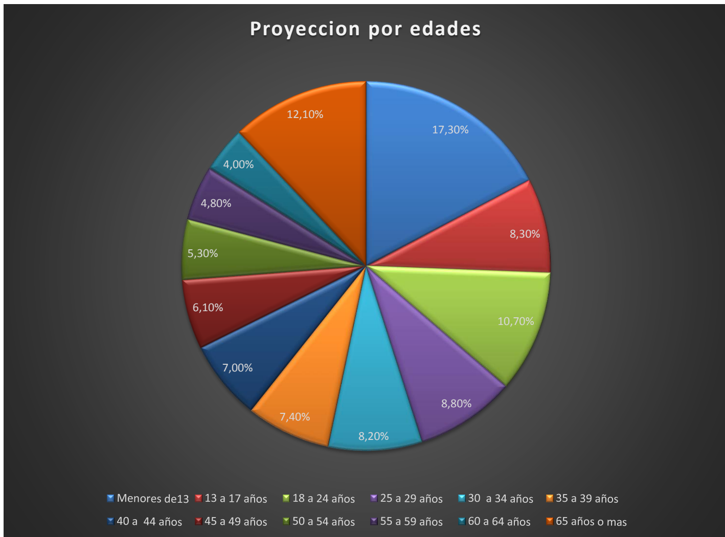
Figura 1. Población del Resguardo Indígena de Cuaspud Carlosama-Proyección según DANE en 2023 según el censo.