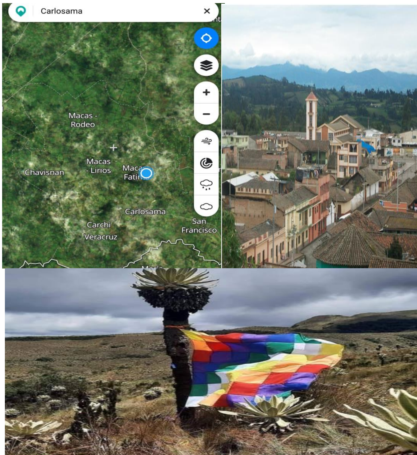
Figura 2: Mapa satelital