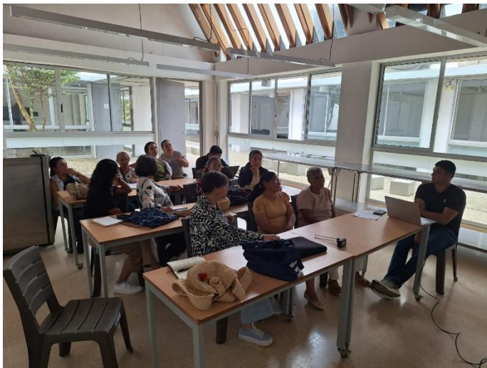
Ilustración 1 Entrevista Emprendedores Concepción abril 11

Anexo B. Evidencia de la aplicación de la entrevista.