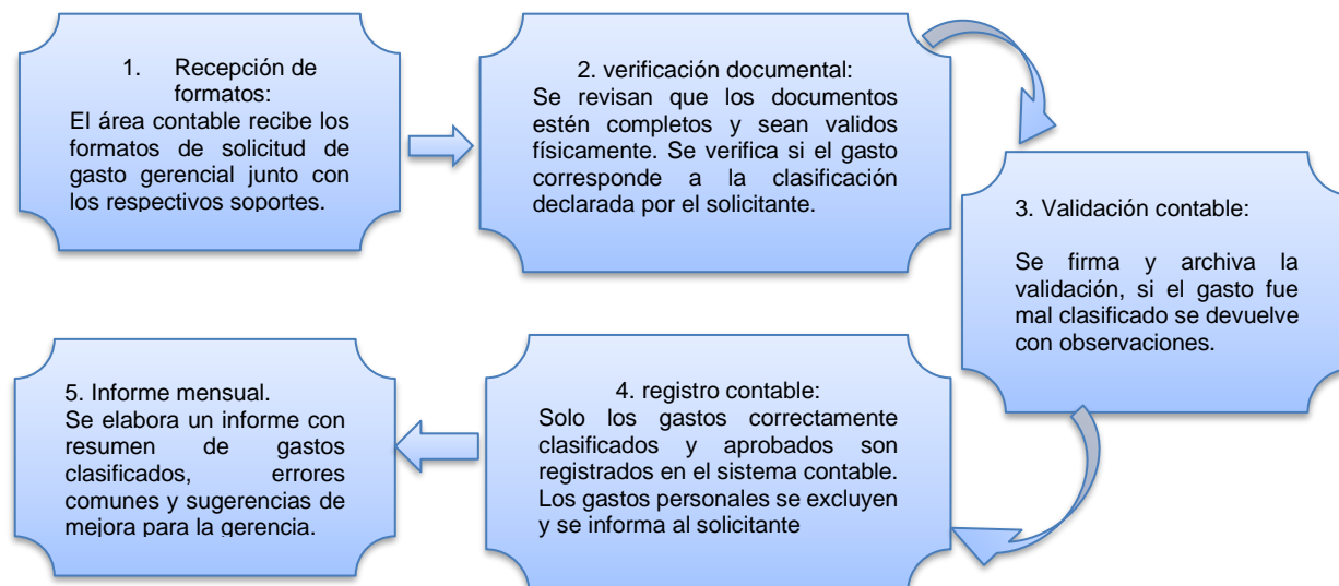
Figura 1. Mapa de procedimiento de validación mensual de gastos gerenciales por parte del área contable.