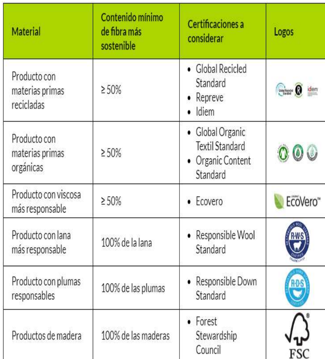
TABLA 1. ESTÁNDARES DE CERTIFICACIONES DE FALABELLA

Fuente página: (falabella-co/page/sostenibilidad).