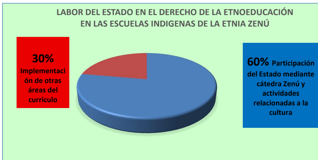
Grafica1: participación del estado en el derecho a la educación indígena

Se puede establecer que las políticas de etnoeducación dadas en el pueblo Zenú, se han tenido en cuenta como parte de la implementación y autonomía de los indígenas en diseñar su propio currículo que los conlleve a formar en los niños, niñas y adolescentes indígenas a la valorar y preservar sus costumbres. El Estado ha extendido la mano con tal de que, por medio de las escuelas del territorio indígena, se hagan cumplir las obligaciones constitucionales en cuanto a los derechos de la etnia en mención.