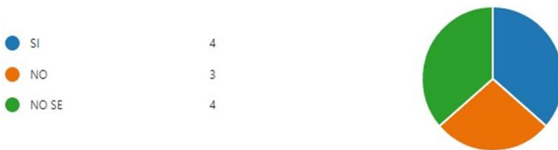
Figura 5. Tiene el Departamento un Impuesto para el Degüello de Ganado

Atendiendo a lo anterior, se puede observar que, más del 50% de las personas encuestadas desconocen en que se basa Rentas Departamentales para establecer la tarifa del impuesto en el departamento de Córdoba. Respondiendo la pregunta de esta encuesta, la renta departamental establece la tarifa para el recaudo de este impuesto, fijando la suma equivalente al 0,83 UVT por unidad de ganado mayor.