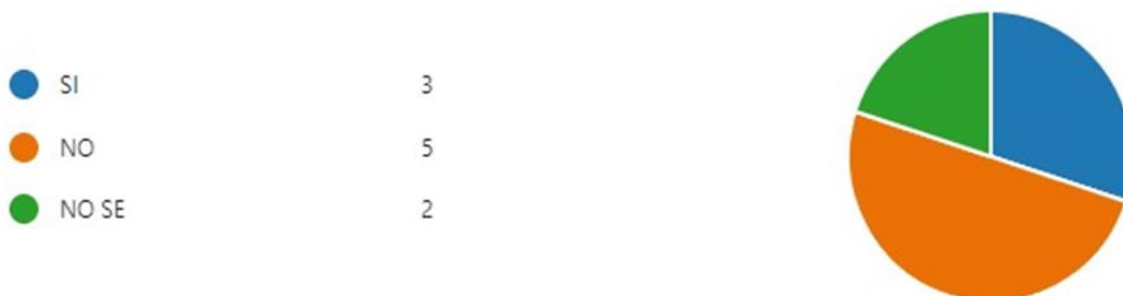
Figura 3. Quien Regula el Impuesto al Sacrificio de Ganado en el Departamento

Se realizo una encuesta a 10 personas, algunas con conocimientos en impuestos. Esto con el objetivo de determinar que tanto conocimiento tienen sobre el impuesto al degüello de ganado mayor y estos fueron los resultados: