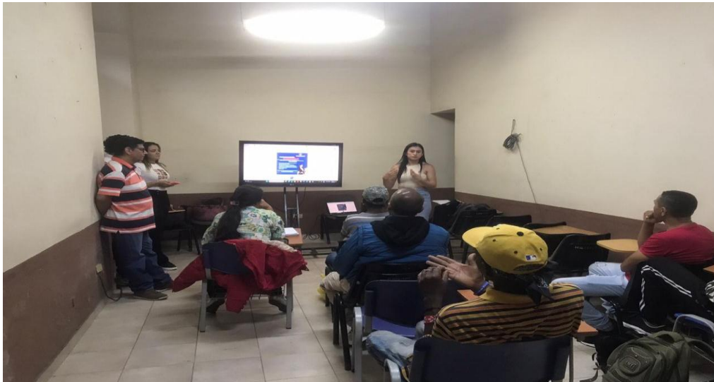
Ilustración 3 Jordana Consultorio NAF - secretaria De Turismo Alcaldía Buga