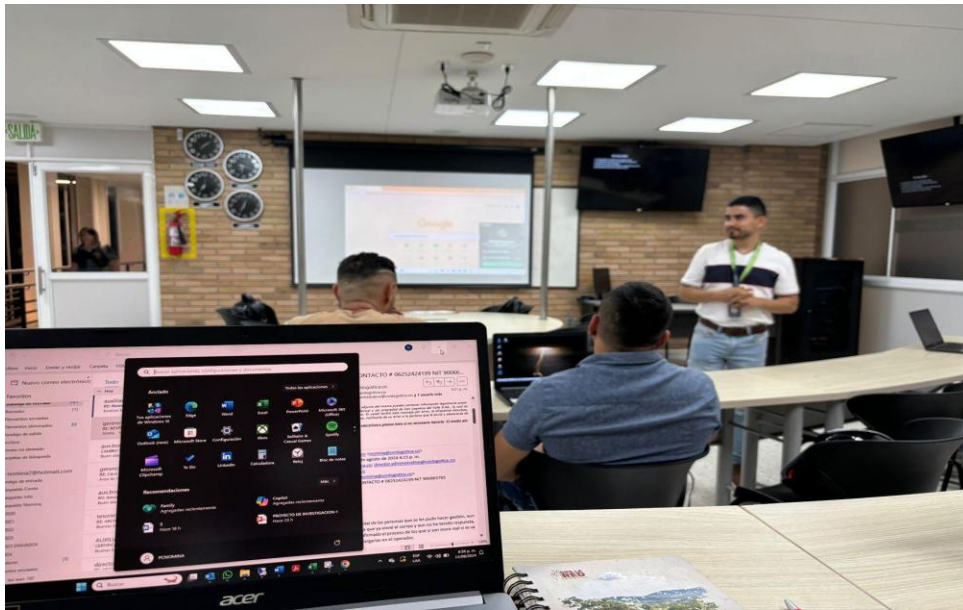
Ilustración 1 DIA 1 | Capacitación