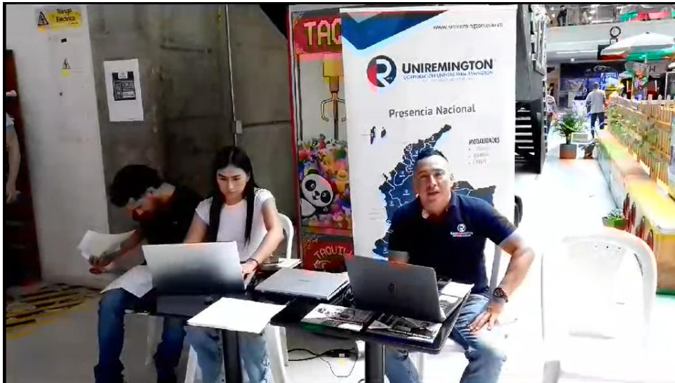
Ilustración 4 Jornada Centro Comercial Bicentenario Plaza – Tuluá

Nota. imágenes realizadas por los autores.