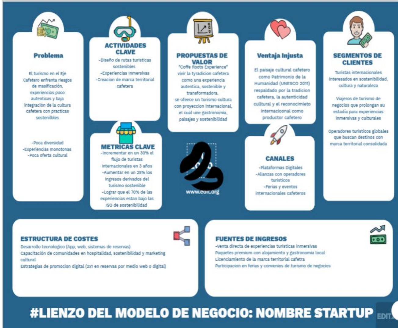
Figura 1. Lean Canvas aplicado al sector del turismo en el eje cafetero.