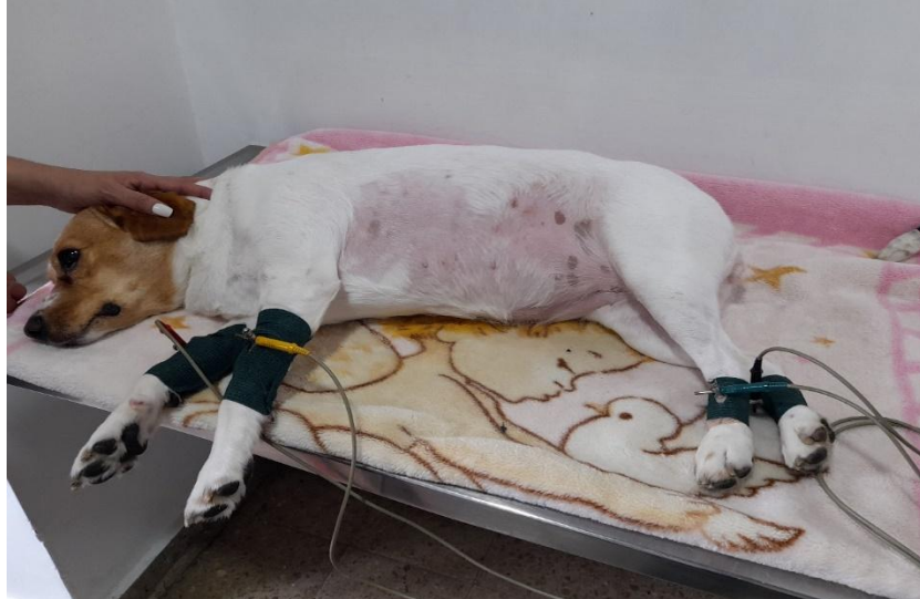
Figura 1. Paciente camino a toma de ECG, de cubito lateral derecho.

necesidad de contemplar posturas alternativas en animales con enfermedades respiratorias o cardíacas, particularmente en clínicas con alto flujo de pacientes críticos.