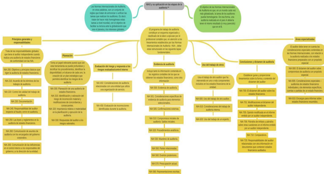
Anexos Figura 1. Las NIAs en el sector empresarial