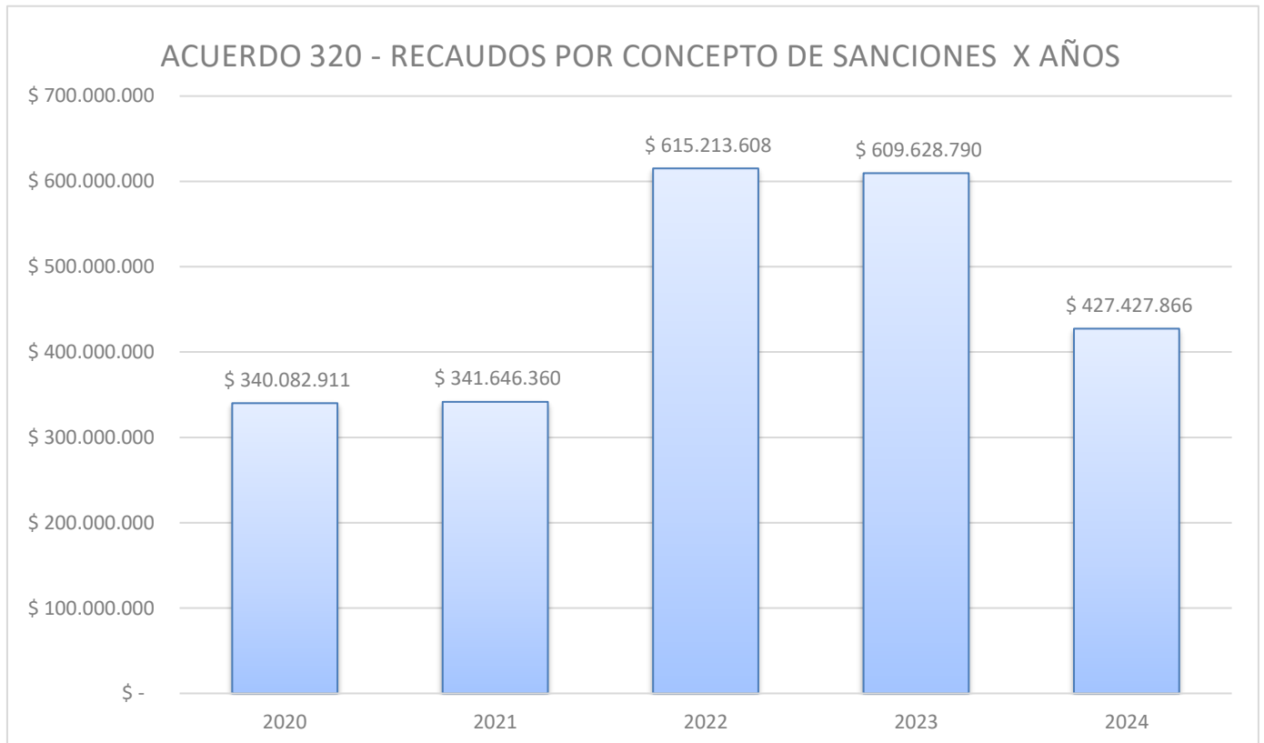
Tabla 2: Recaudos semestrales.