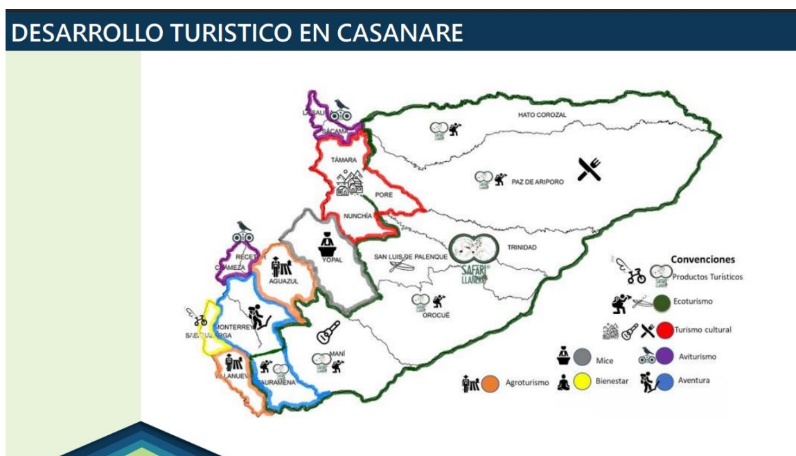
11 Ilustración 3 Mapa de Casanare

Por ende en el departamento del Casanare, los empresarios se vieron en la necesidad de emprender en nuevos proyectos, debido a la dependencia que se tenía de la explotación de los hidrocarburos, por tal motivo, con el apoyo de la cámara de comercio, se empezó a explorar la posibilidad de aprovechar las riquezas naturales recursos naturales, la cultura y la gastronomía de la región llanera, fortaleciendo el turismo naturaleza, como el motor del desarrollo sostenible de Casanare, generando incremento en la tasa de empleo y la economía, beneficiando a los habitantes locales, los cuales desarrollaron actividades autóctonas de la región para atraer turistas locales, nacionales e internacionales.