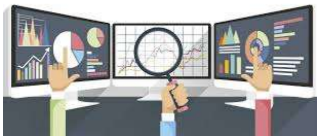
Figura 2. Ámbito empresarial y la toma de decisiones

En el ámbito empresarial, la toma de decisiones basada en datos es conocida como Data-Driven Decision Making – (DDDM), esto implica el uso sistemático de datos y análisis cuantitativos para guiar las decisiones estratégicas y operativas. Davenport y Harris (2007) sostienen que las empresas que adoptan un enfoque basado en datos tienen una ventaja competitiva sostenible al mejorar la precisión, rapidez y eficacia de las decisiones. En este aspecto, se tienen las siguientes fases: