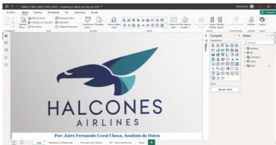
Figura 4. Análisis de Datos para Halcones Airlines

Power BI es una herramienta de análisis y visualización de datos desarrollada por Microsoft. Se utiliza ampliamente en el ámbito empresarial para transformar datos en información significativa y visualmente atractiva mediante la integración, modelado y visualización de datos en tiempo real. Según Microsoft (2022), más de 250,000 empresas en todo el mundo utilizan Power BI para apoyar sus procesos de toma de decisiones.