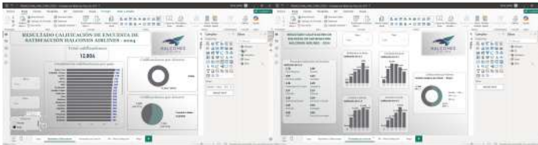
Figura 5. Tablero interactivo luego del análisis de datos