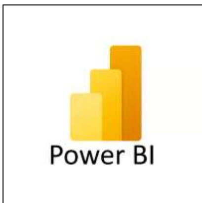
Figura 3. Herramienta de análisis y visualización de datos

Power BI es una herramienta de análisis y visualización de datos desarrollada por Microsoft. Se utiliza ampliamente en el ámbito empresarial para transformar datos en información significativa y visualmente atractiva mediante la integración, modelado y visualización de datos en tiempo real. Según Microsoft (2022), más de 250,000 empresas en todo el mundo utilizan Power BI para apoyar sus procesos de toma de decisiones.