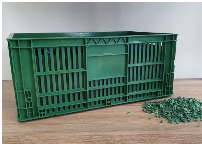
Ilustración 3. Plan de renovación de canastas