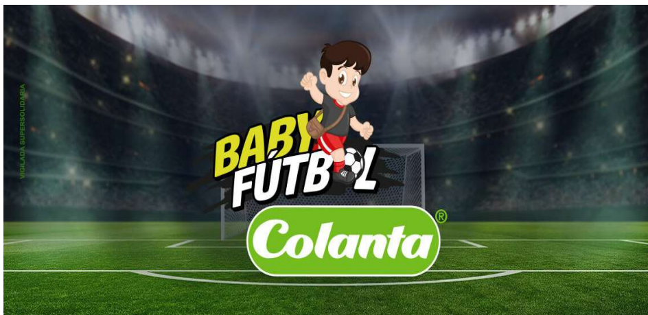
Ilustración 2. Baby Futbol Colanta

“Como requisito para la inscripción al torneo Baby Fútbol, cada equipo debía entregar 300 empaques limpios de leche pasteurizada o UHT”(Programas de posconsumo y proyectos piloto de economía circular de Colanta Noticias Sabe+, s/f).