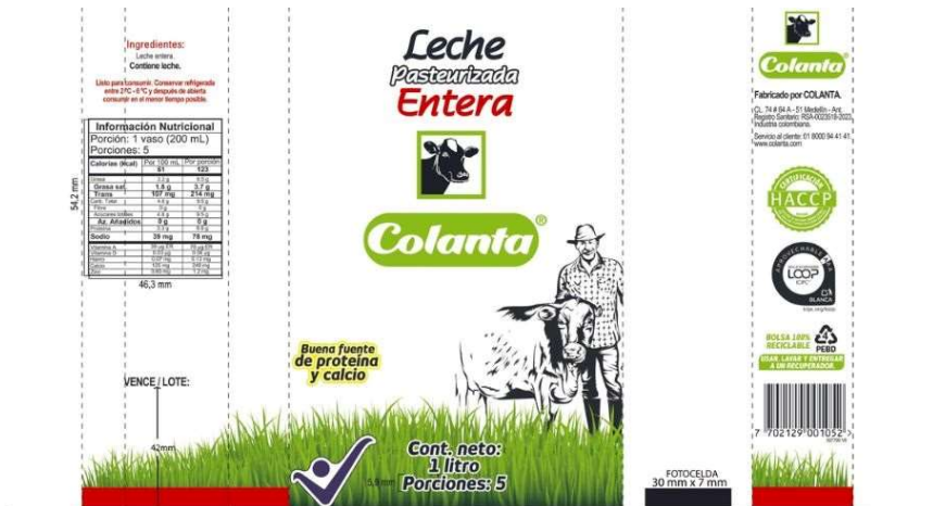
Ilustración 4. Eco-diseño