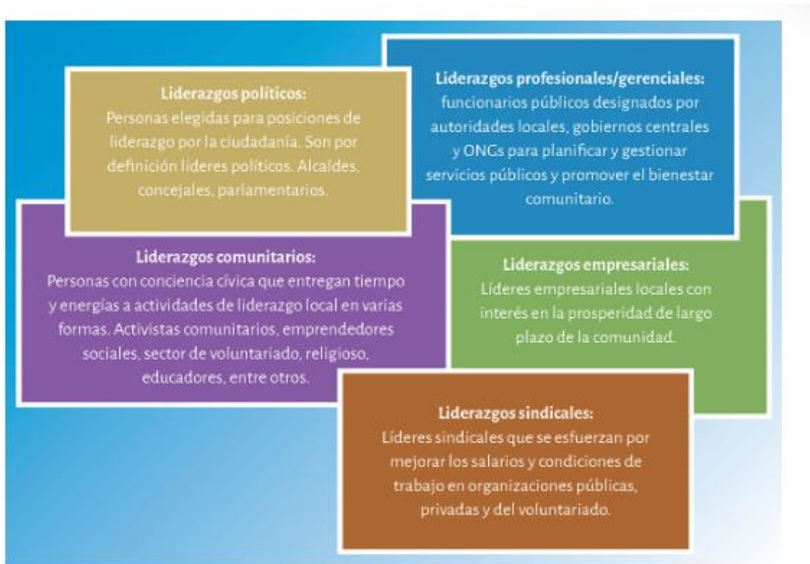
Figura 1. liderazgos que juegan roles clave en el desarrollo local Fuente: (Observatorio Regional de Planificación para el Desarrollo Fuente Hambleton, 2014)

Las perspectivas contemporáneas consideran el liderazgo como procesos emergentes influenciados por individuos que actúan de maneras que afectan estas dinámicas. Aunque se reconocen diferentes estilos de liderazgo, como transaccional y transformacional, la combinación de ambos, conocida como liderazgo mixto, puede ser más efectiva. En el ámbito territorial, el liderazgo colaborativo en el sector público ha ganado importancia, evidenciado por diversas iniciativas solidarias durante la pandemia COVID-19 (Observatorio Regional de Planificación para el Desarrollo, 2021).