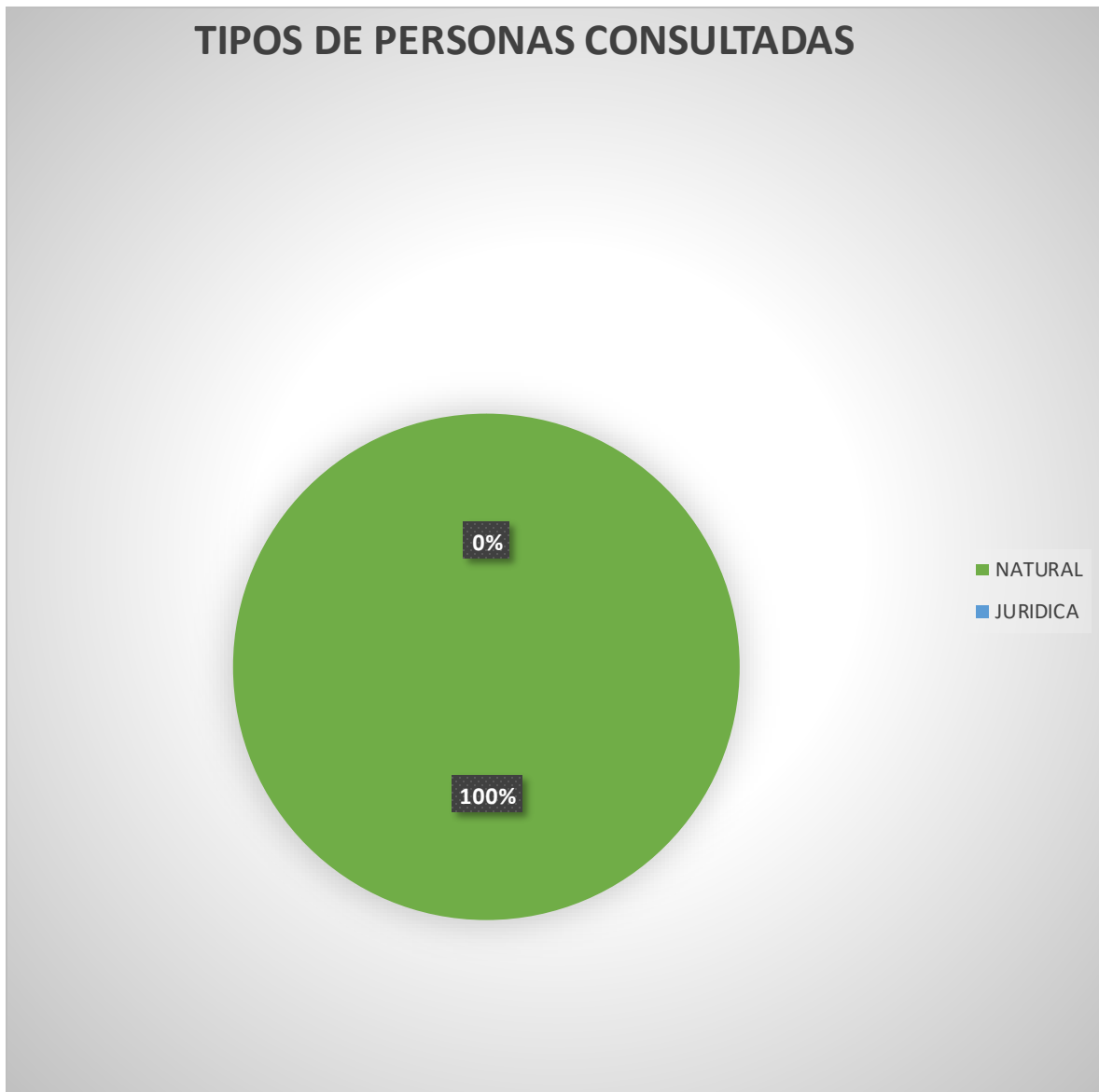
Grafica circular 1. Tipos de personas consultadas.