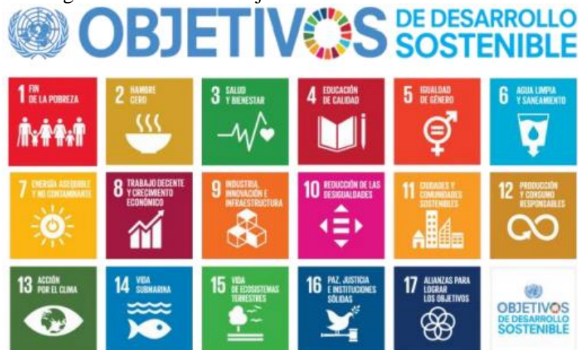
Figura No 1: Los 17 Objetivos de Desarrollo Sostenible.

En cuanto a los Objetivos de Desarrollo Sostenible “ODS”, un conjunto de 17 objetivos los cuales fueron determinados y adoptados por las Naciones Unidas en el año 2015, siendo estos un llamado a las acciones para que en los 15 años siguientes lleven a poner fin a la pobreza, proteger el planeta y garantizar la paz y prosperidad de todas las personas para el año 2030 (United Nations, 2022).