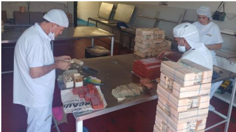
Figura N° 4: Correspondiente al personal con la utilización de los EPP