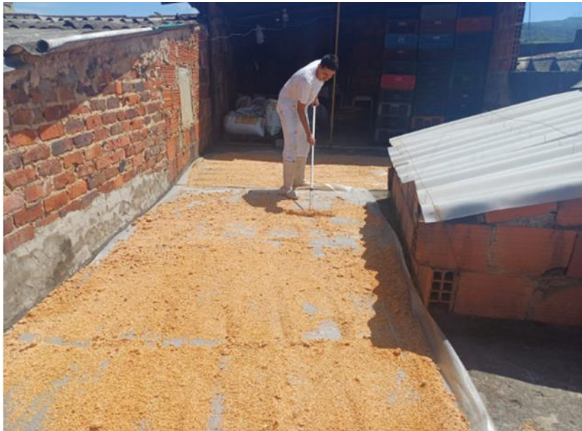
Figura No 5: Operario realizando la esparción y secado de la semilla de guayaba