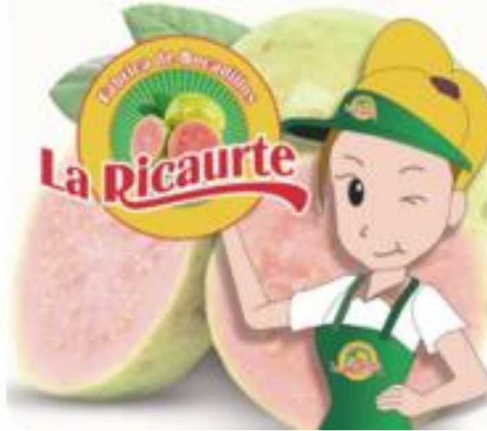
Figura N° 3: Logo Corporativo empresa de bocadillos La Ricaurte