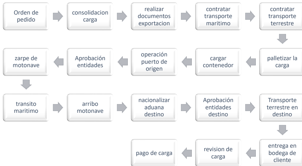
Diagrama 1. Proceso de exportación hasta Chile

Orden de pedido: Mediante una orden de pedido el cliente se comunica con el equipo comercial de la compañía para realizar una orden de pedido especificando productos, cantidades, fechas de entrega y logística a utilizar para el movimiento de la carga.