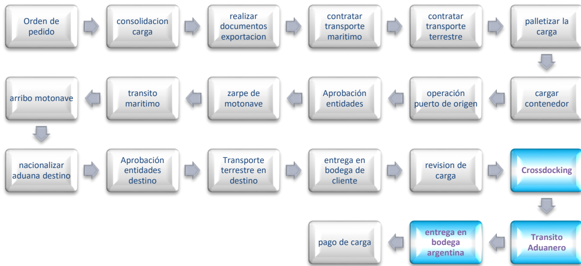
Diagrama 2. Proceso de exportación hasta Argentina.

Para el proceso de exportación hasta Argentina se propone realizar el proceso actual de exportación hasta Chile y continuar hacia Buenos Aires mediante un transporte terrestre en la modalidad de transito aduanero: