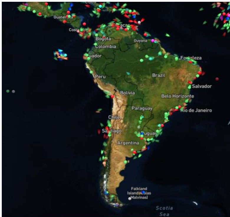
Figura 2. Mapa Sur America

La exportación de flores a Argentina ha estado en niveles bajos durante los últimos años por la complejidad logística, la economía del destino y el consumo y cultura de los suramericanos en cuanto al consumo de flores frescas. Se busca con esta propuesta encontrar una manera viable económica y logísticamente de llegar a Argentina con un producto fresco y de alta calidad conservando la cadena de frío vital para la calidad y duración de los productos.