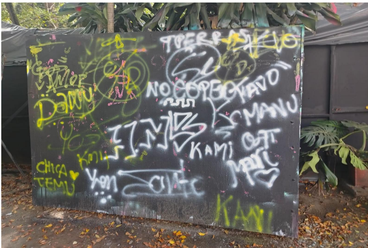
Ilustración 7. Evidencias fotográficas 6.