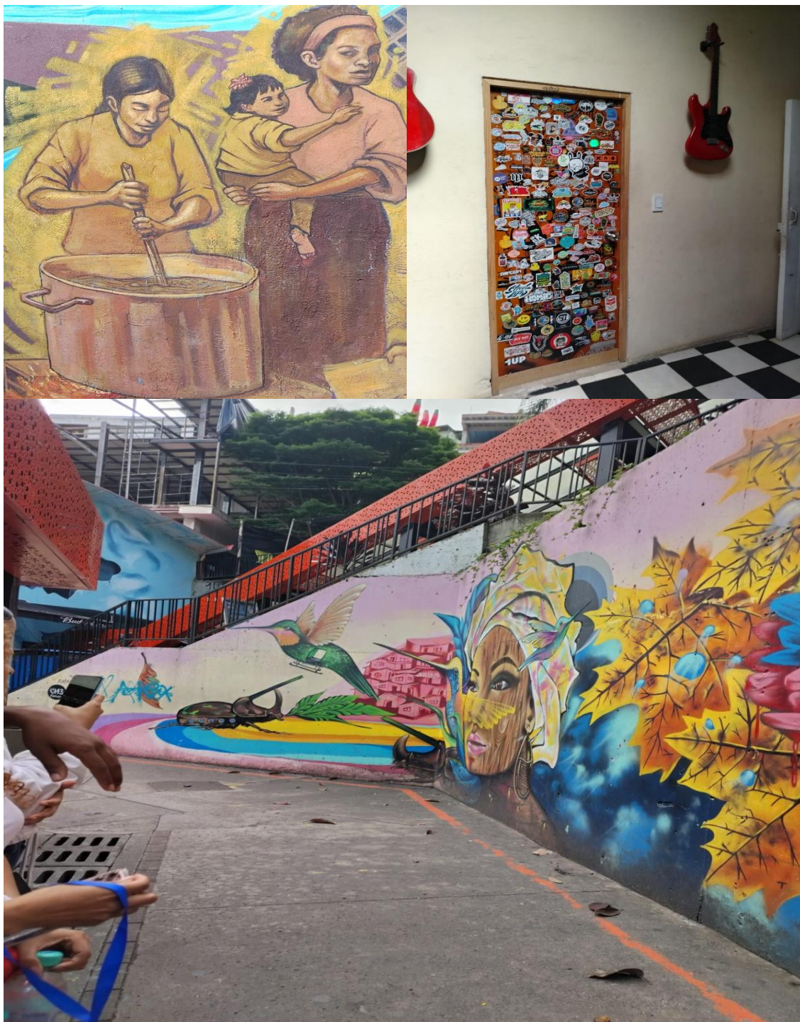
Ilustración 3. Evidencias fotográficas 2.