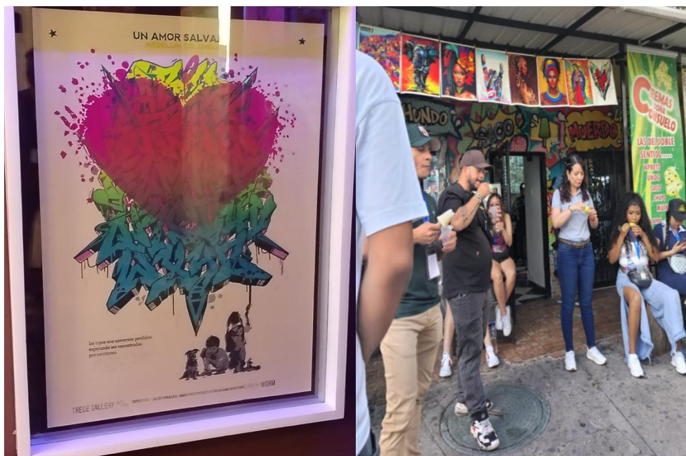
Ilustración 6. Evidencias fotográficas 5.