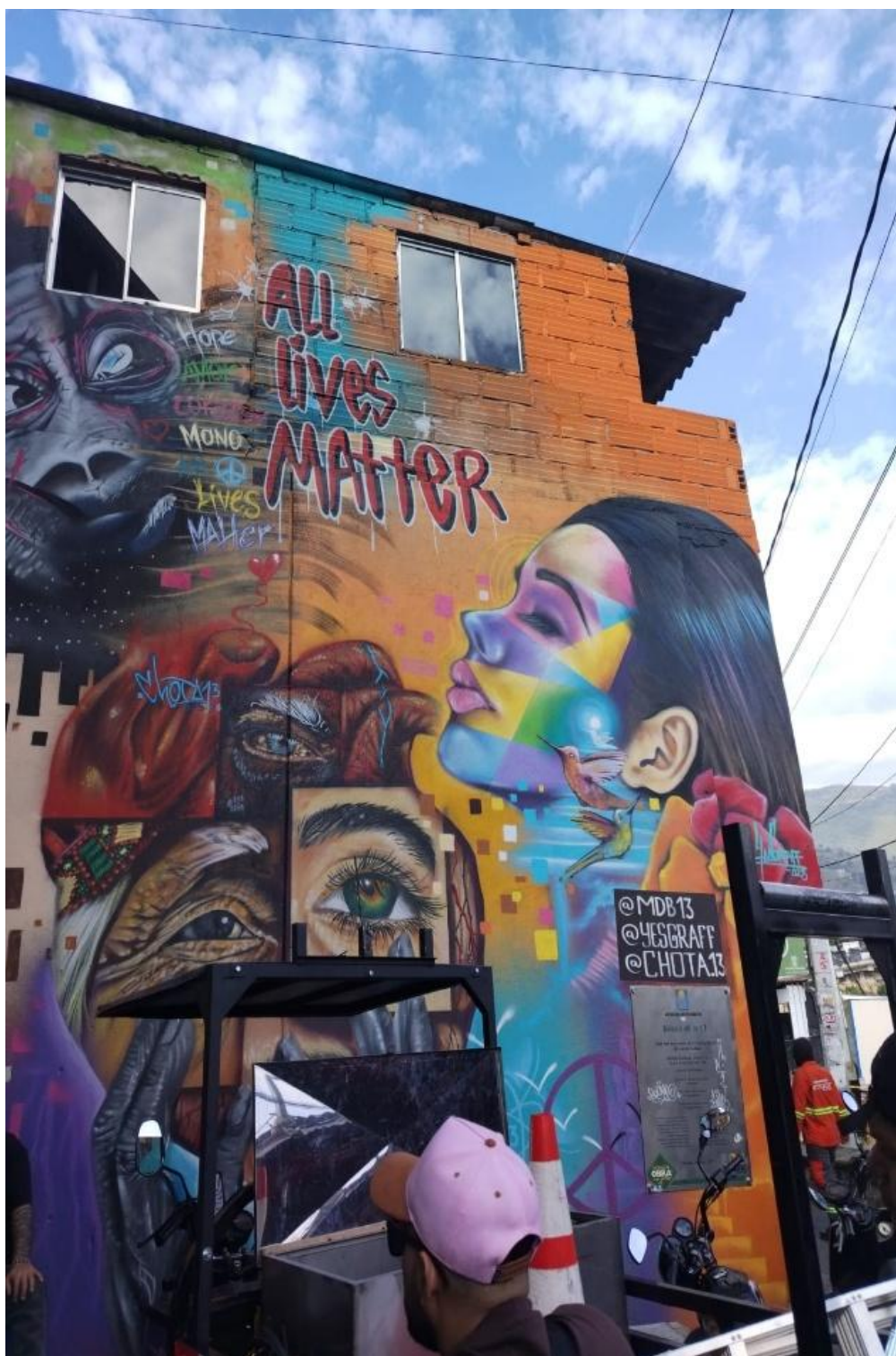
Ilustración 4. Evidencias fotográficas 3.