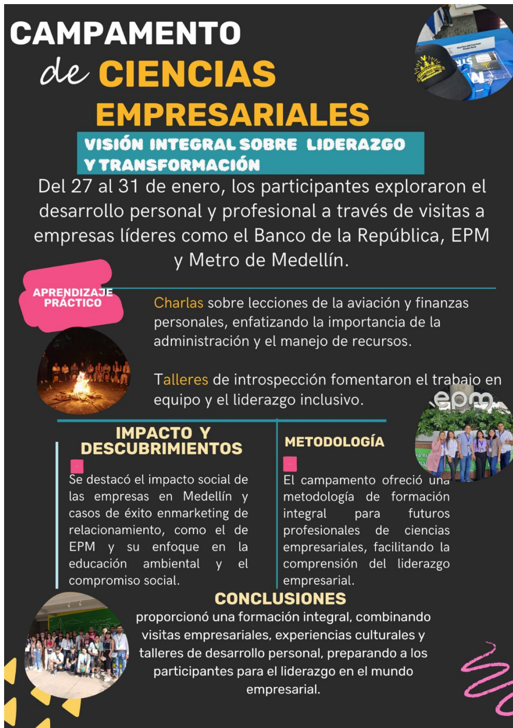
Ilustración 1. Poster.