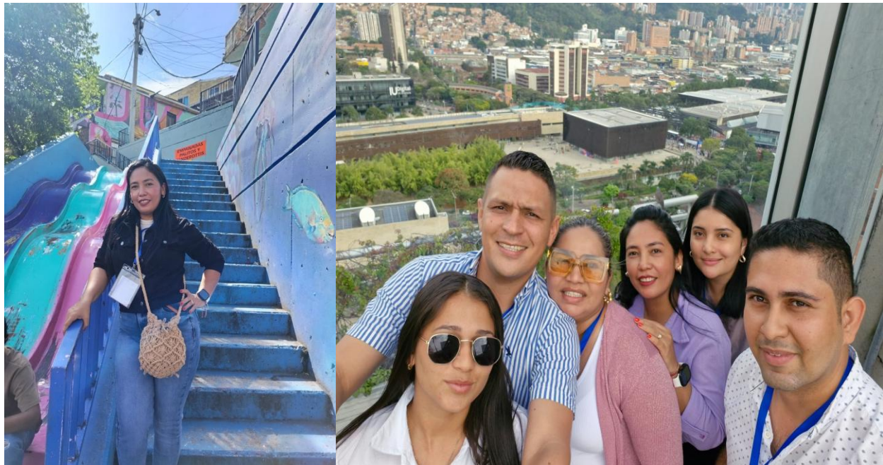
Ilustración 5. Evidencias fotográficas 4.