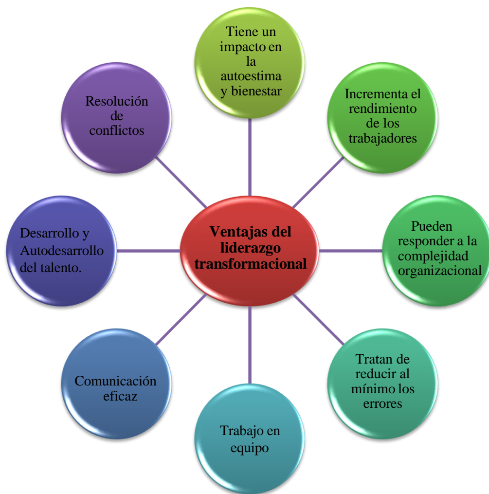
Ilustración V. Ventajas del líder transformacional. (Fuente propia)

Tras reconocer la importancia del liderazgo transformacional se entiende que realmente es aplicable para la gestión del cambio en El Corral – Hamburguesa, por ello, se analizó el liderazgo transformacional desde el modelo de Kurt Lewin y como se podría ajustar de acuerdo con las 3 fases que hacen parte de este: fase de descongelamiento, fase cambio y fase de re-congelamiento.