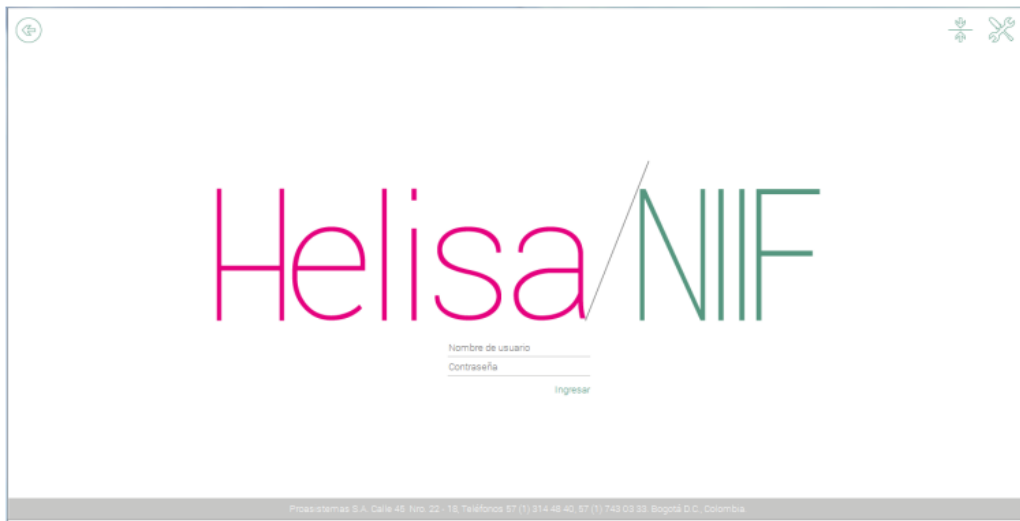
Figura 2. Software Helisa.

La empresa cuenta con un software para la contabilidad y la nómina el cual es Helisa, en el cual se tiene acceso a diferentes módulos.