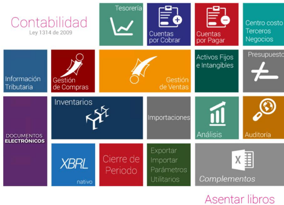
Figura 3. Módulos software Helisa.