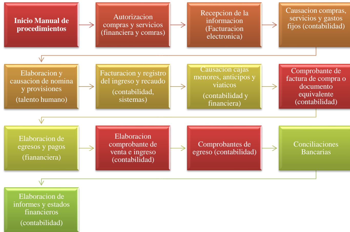
Figura 1. Diagrama de flujo procedimiento contable y financiero.