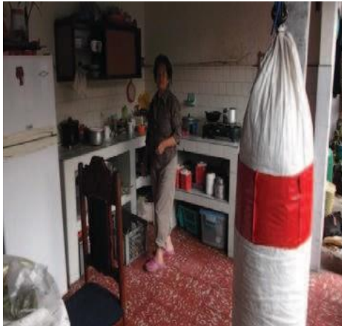
Patio de ropas