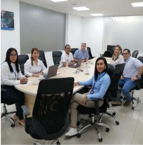
Ilustración 8: Registro fotográfico de actividades realizadas